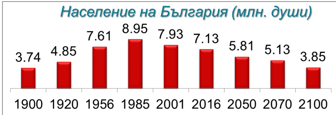
Фиг. 3. Население на България от 1900 до 2100 година

Пояснение: Данните от 1900 до 2001 г. са от съответните преброявания на населението, за 2016 г. – по оперативни данни на НСИ, а за 2050-2100 г. – осреднени прогнози на Икономическия и Социален съвет на ООН и на други институции.